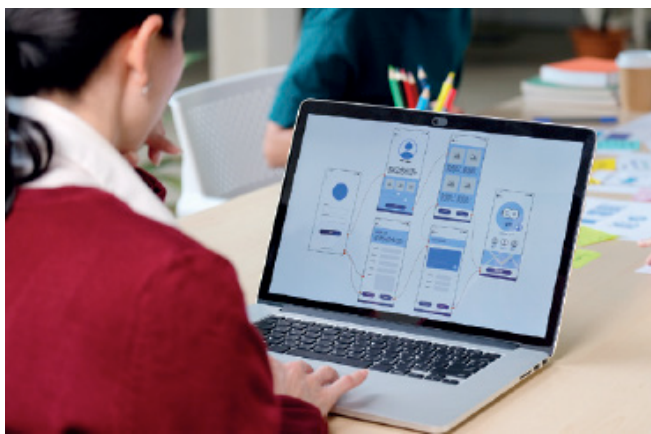
FIGURA 1. Esta herramienta te debe ayudar a ti y a los que consulten tu blog a entender mucho mejor el tema usando contenidos multimedia.

Utilizarás una página web para compilar y difundir enlaces a recursos educativos abiertos (videos, libros, simuladores libres) que estén relacionados con otra asignatura.