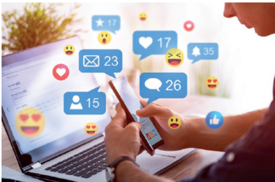
FIGURA 1. Las opiniones en las redes sociales son muy diversas, además de ser muy espontáneas, sin filtro e influenciables, esto les da un sentido muy relativo y pueden gestarse rápidamente las fake news , funas o viralización de ciertos personajes o situaciones.

Aplicarás un análisis en línea de contenido de comentarios, aplicando la técnica de Análisis en Línea de Contenido (ACEL) para estudiar los comentarios de un video de YouTube o de una noticia digital relacionada con una problemática social o política. A partir de este análisis, identificarás los argumentos más comunes y organizarás los hallazgos por categorías, por ejemplo: a favor, en contra o neutros.